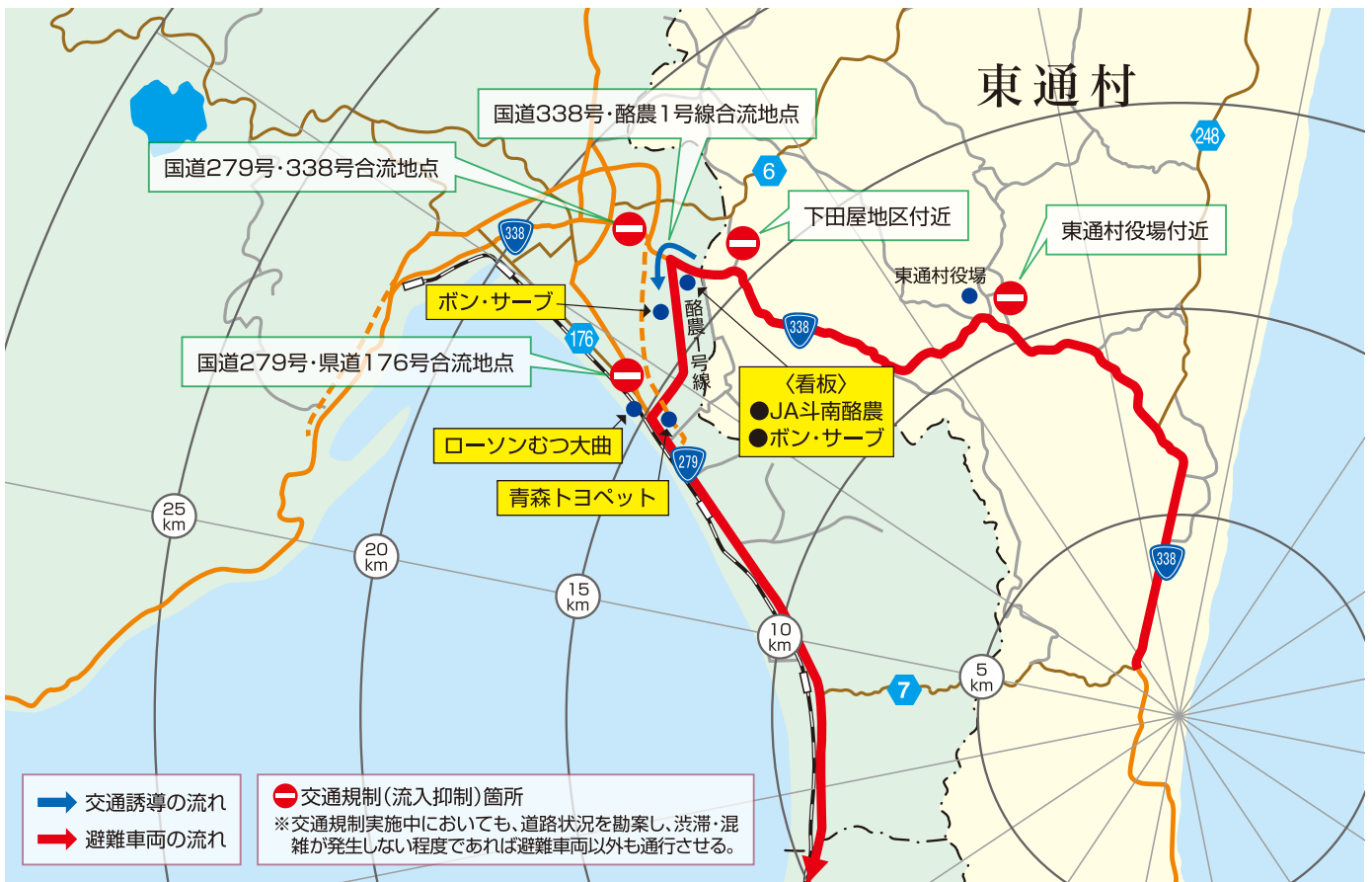
東通原子力発電所の原子力災害時における広域避難の基本的な考え方(平成28年3月)を基に作成