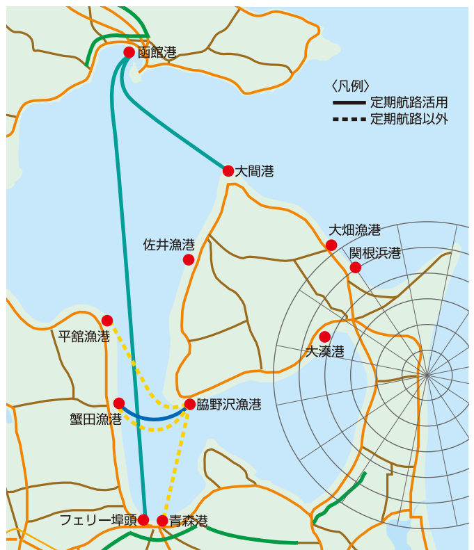
東通原子力発電所の原子力災害時における広域避難の基本的な考え方(平成28年3月)を基に作成